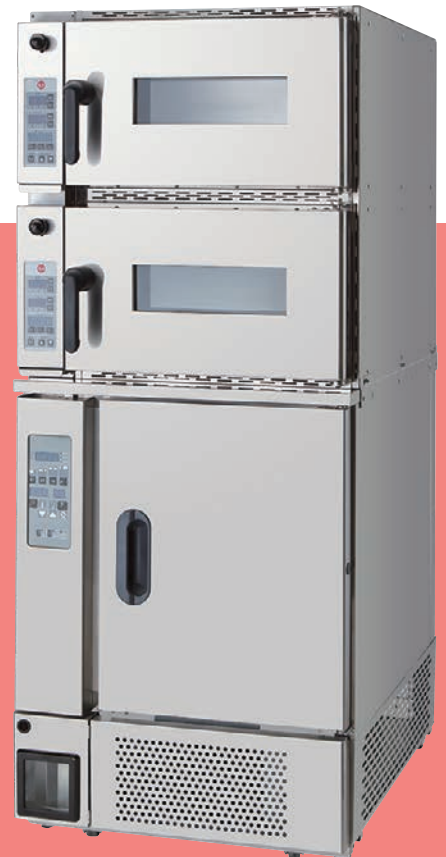
ドウコンディシヨナー

1日あたり800~1000個の焼成能力で 従来の約1/3のスペースで設置可能なオーブンです