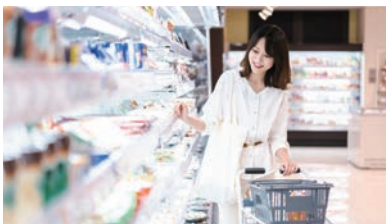
スーパーマーケット