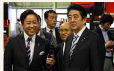
▲最新機械のデモンストラーションでは、「まるで人の手のように動きますね」と関心した様子