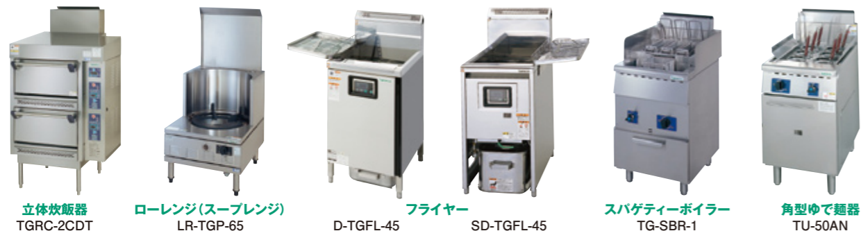
立体炊飯器 TGRC-2CDT ローレンジ(スープレンジ) LR-TGP-65 D-TGFL-45 フライヤー SD-TGFL-45 スパゲティーボイラー TG-SBR-1 角型ゆで麺器 TU-50AN

従来、「ガス厨房＝暑い」と思われていた が、排熱を集中排気し、機器からの放熱を 大幅に軽減することで、触っても熱くない、 涼しいガス厨房機器が続々登場しています。 既築のガス機器を「涼厨。」に入れ替えるだけ でグッと涼しい厨房に生まれ変わります。