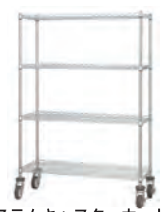
(STEMキャストカート付)